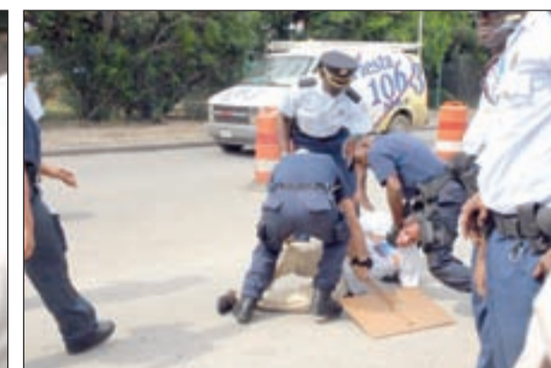
Polis ta tackle y drop un manifestante cu su borchí